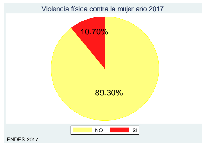
Figura 3. Porcentaje de violencia física contra la mujer año 2017

Se determina en el siguiente grafico de la violencia física de la mujer año 2017, del total de las mujeres encuestadas un porcentaje de 89.30% no sufrieron violencia física siendo menos que el año anterior y el restante de 10.30% fueron víctimas de algún acto violento (Figura 3).