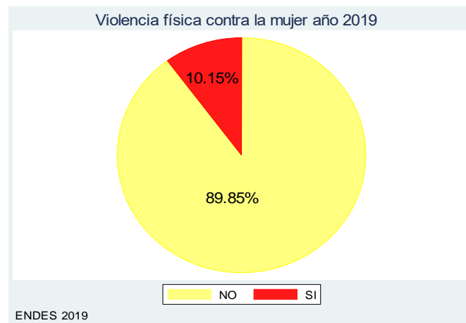
Figura 5. Porcentaje de violencia física contra la mujer año 2019

En el posterior gráfico de la violencia física de la mujer año 2019, de las mujeres encuestadas que en un porcentaje de 89.85% no sufrieron violencia física y el restante de 10.15% fueron víctimas de algún acto violento (Figura 5).