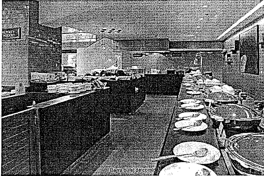
Barra buffet de comida

📍 Blvd Dr Belisario Domínguez 1195, Col Santa Elena Tuxtla Gutiérrez, Chiapas México (ver mapa)